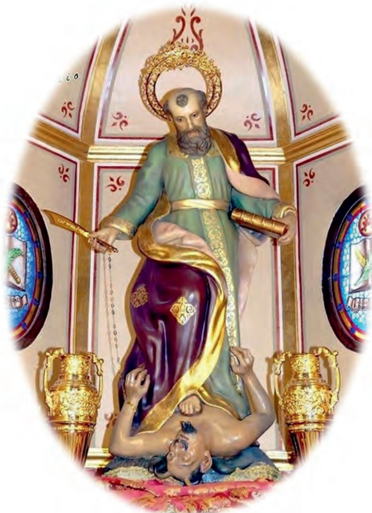
San Bartolomé Apóstol