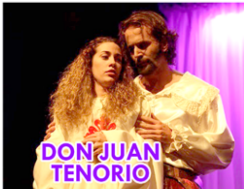
DON JUAN TENORIO